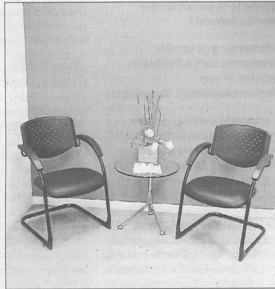
Un dels espais comuns del centre de negocis