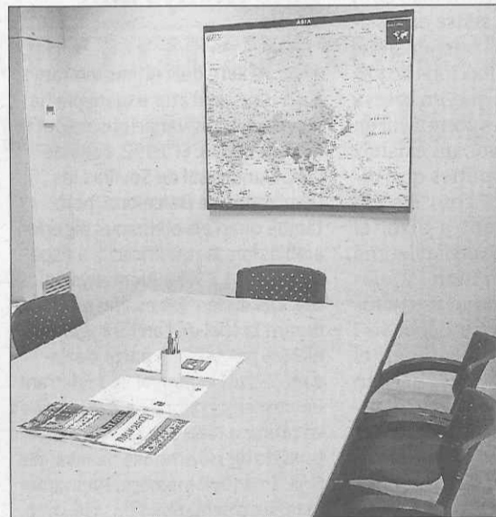
L'empresa disposa de diverses sales de reunions